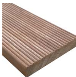
【表面リブ加工あり】

// SPEC // 20mm x 105mm x 【2000mm/3000mm/4000mm】