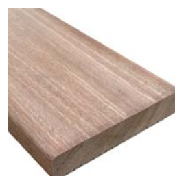
【裏面リブ加工なし】