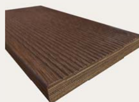
【表面リブ加工あり】