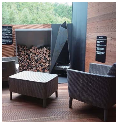
施工例【セランガンバツ】