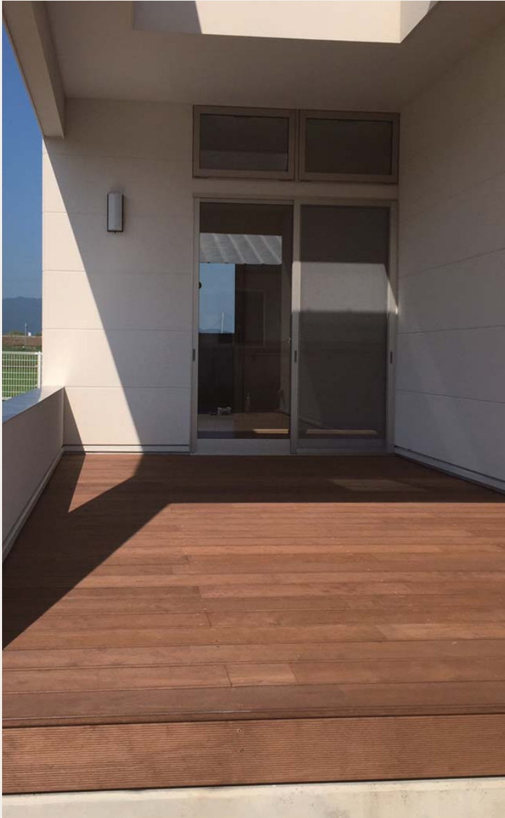
施工例【ナチュラルテック】