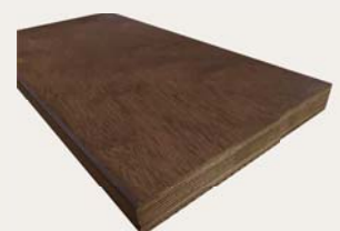
【裏面リブ加工なし】